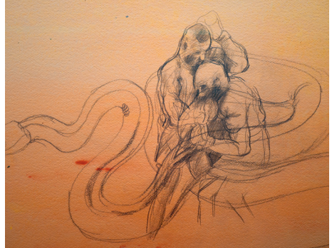
Ⓞ Johan Creten, La Bataille Orange , 2001, Crayon noir et lavis à l'acrylique sur papier Arches. Collection de l'artiste

RDV DANS LE HALL DU MUSÉE DES BEAUX-ARTS