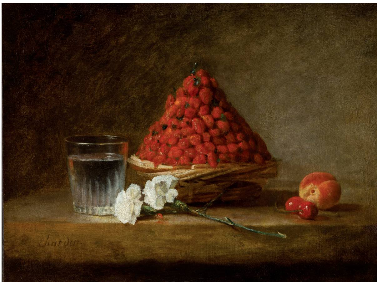
Jean Siméon Chardin (1699 - 1779), Le Panier de fraises des bois, 1761, 38×46 cm, Paris, Musée du Louvre, Département des Peintures, inv. RFML.PE.2024.7.1, TR 79

« Ô Chardin ! ce n'est pas du blanc, du rouge, du noir que tu broies sur ta palette : c'est la substance même des objets, c'est l'air et la lumière que tu prends à la pointe de ton pinceau et que tu attaches sur la toile »