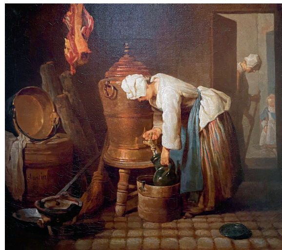
Jean Siméon Chardin (1699 - 1779) La fontaine, vers 1733 Collection particulière, prêt exceptionnel au musée des Beaux-Arts d'Orléans depuis mars 2024