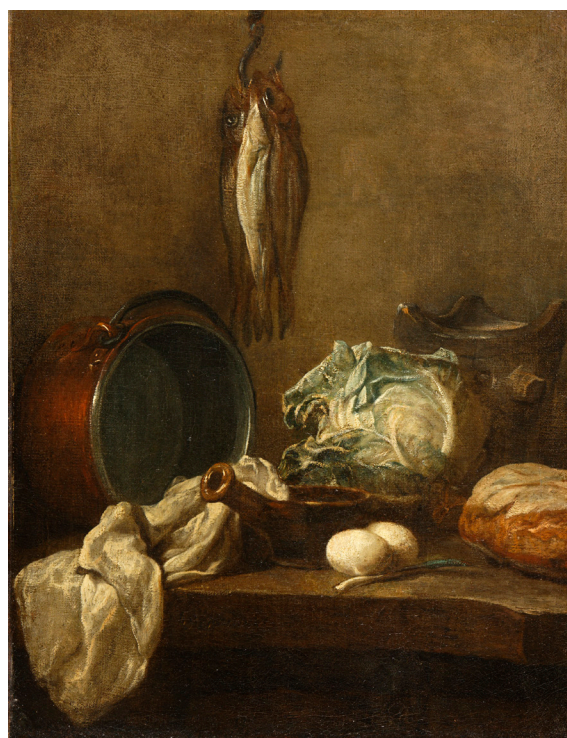
Jean Siméon Chardin (1699 - 1779) Nature morte avec chaudron, poëlon, fourneau, torchon, chou, deux oeufs, poireau, pain et trois harengs Entre 1731 et 1733, inv. M.P.Lav.1894-139, collection Musée de Picardie, Amiens