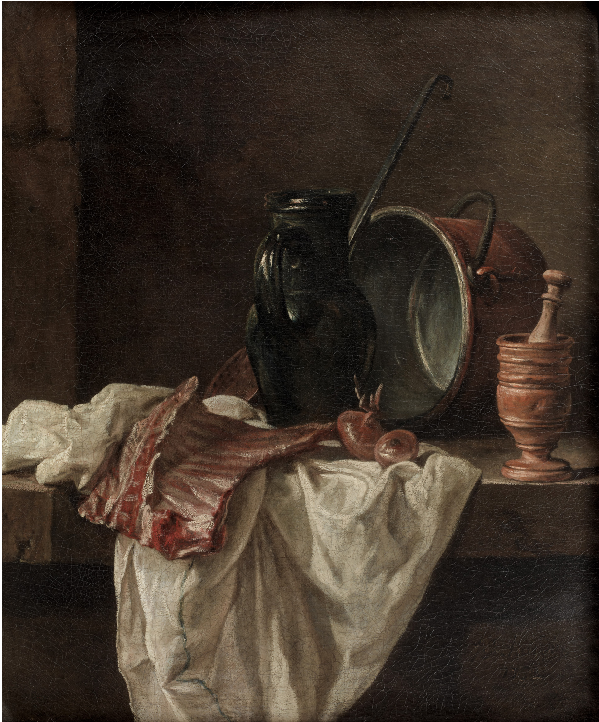
Jean Siméon Chardin (1699 - 1779), Nature morte à la côtelette, Paris, Musée Jacquemart-André – Institut de France