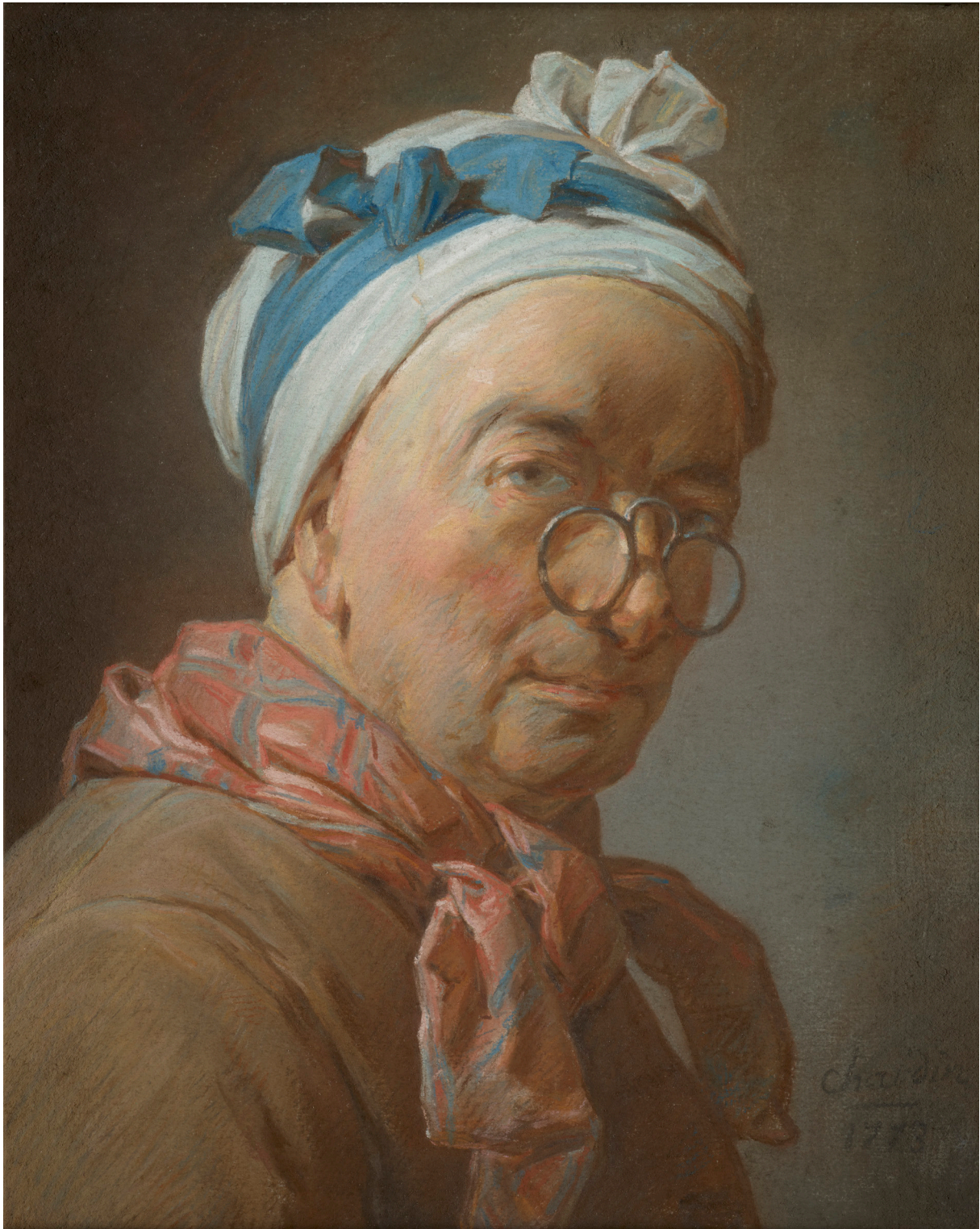
Jean Siméon Chardin (1699 - 1779), Autoportrait aux bésicles , 1773, 45,5×38 cm, Orléans, musée des Beaux-Arts, inv. 91.5.1