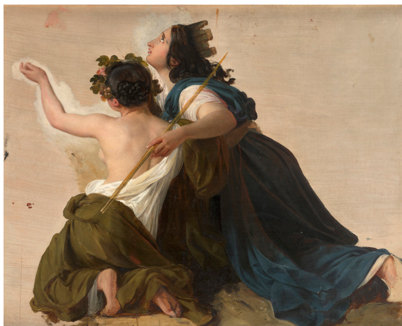
FRANÇOIS ÉDOUARD PICOT (PARIS, 1786 – Id. , 1868) Herculanum et Pompéi

Son irrépressible passion pour la peinture de genre historique romantique, qui se croise chez lui dans les tableaux d'artistes aujourd'hui peu connus du grand public et qu'il a appris à connaître en suivant le marché de l'art, le met en symbiose avec les musées de Montpellier, de Nantes et d'Orléans, et jamais il n'achète sans la certitude qu'il n'enchéra pas contre un musée, sinon pour lui offrir le tableau. Paul Delaroche, qui manque encore dans la collection, aurait pu y entrer avec un Sacre de Charlemagne si Antoine Béal n'avait pas récemment laissé la priorité au château de Versailles !