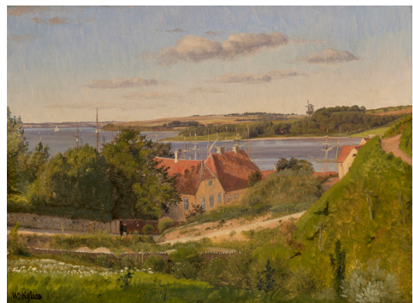
PETER VILHELM CARL KYHN (COPENHAGUE, 1819 – FREDERIKSBERG, 1903) Vue du port de Skive

Milieu du XVII e siècle Huile sur toile 79 x 69 cm Paris, collection Antoine Béal