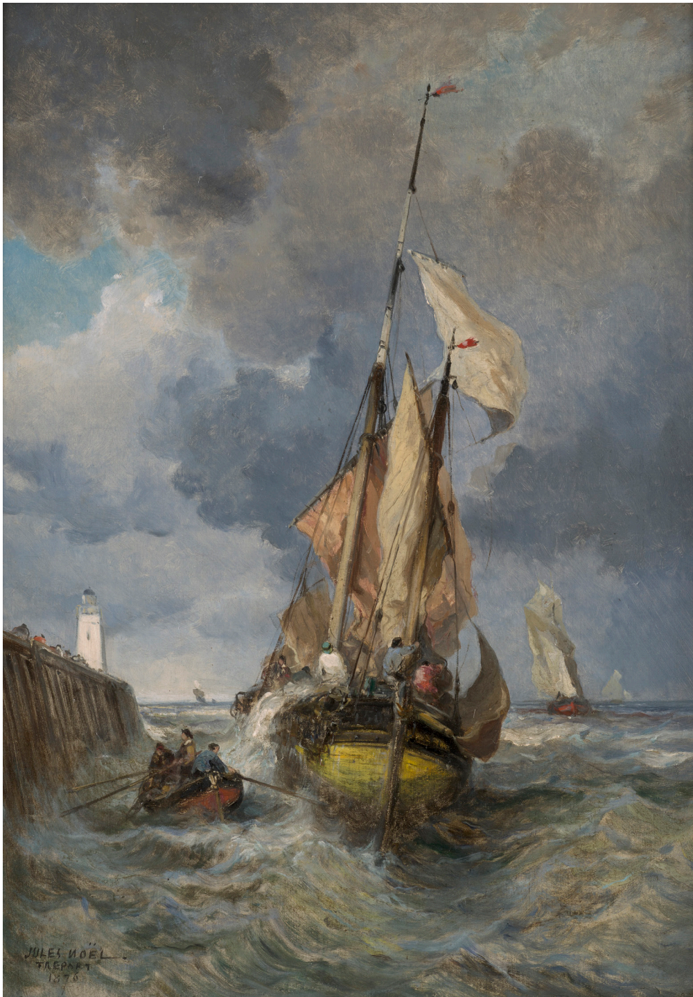
JULES NOËL (NANCY 1810 — ALGER 1881) Voilier à l'entrée du port du Tréport