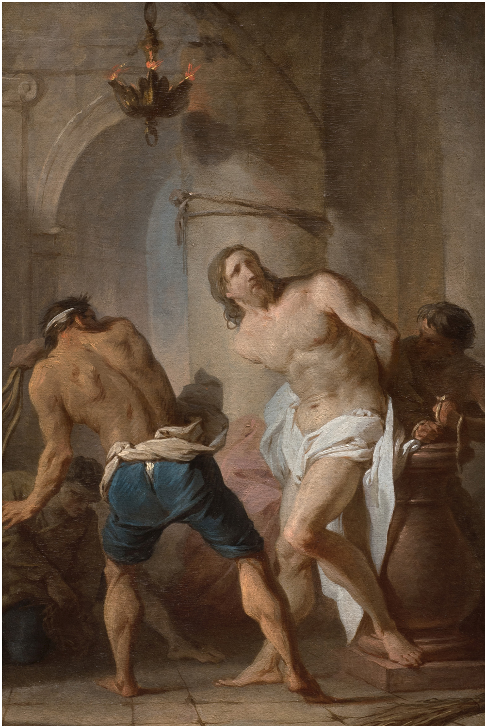
PIERRE SUBLEYRAS (SAINT-GILLES, 1699 — ROME, 1749) La Flagellation du Christ

Vers 1730-1731 Huile sur papier marouffé sur toile 19 × 36 cm ; 38,5 × 26,4 cm Paris, collection Antoine Béal