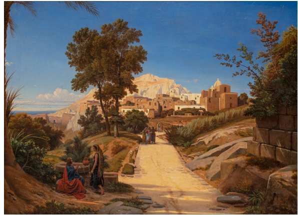
THÉODORE CARUELLE D'ALIGNY (CHANTENAY-SAINT-IMBERT, 1798 – LYON, 1871) Le Christ et la Samaritaine