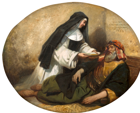
CLAUDIUS JACQUAND (LYON, 1804 – PARIS, 1878) En Orient la charité d'une moniale

1837 Huile sur toile 74,2 x 99 cm Paris, collection Antoine Béal