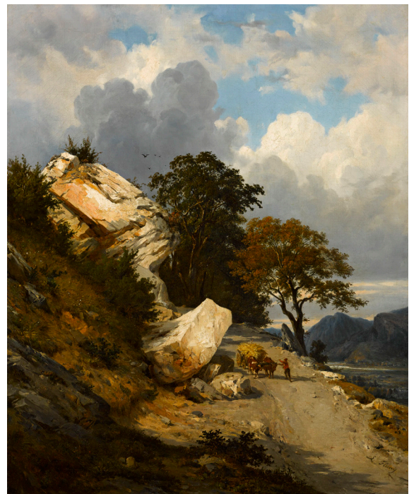
LÉON FLEURY (PARIS, 1804 – id. , 1858) Chemin dans les rochers, à Sassenage

1838 Huile sur toile 162 × 205 cm Paris, collection Antoine Béal, don sous réserve d'usufruit au musée du Louvre Inv. RF 2008 8