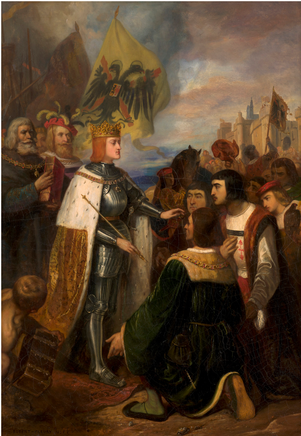
JOSEPH-NICOLAS ROBERT-FLEURY (COLOGNE, 1797 – PARIS, 1890) L'Arrivée de Charles-Quint en Espagne

1835 Huile sur toile 78 x 55 cm Paris, Collection Antoine Béal