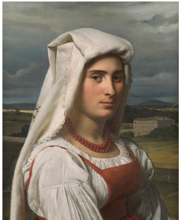
GUILLAUME BODINIER (ANGERS, 1796 – id. , 1867) Une Italienne, en buste

1837 Huile sur toile 72 x 83,7 cm Paris, collection Antoine Béal