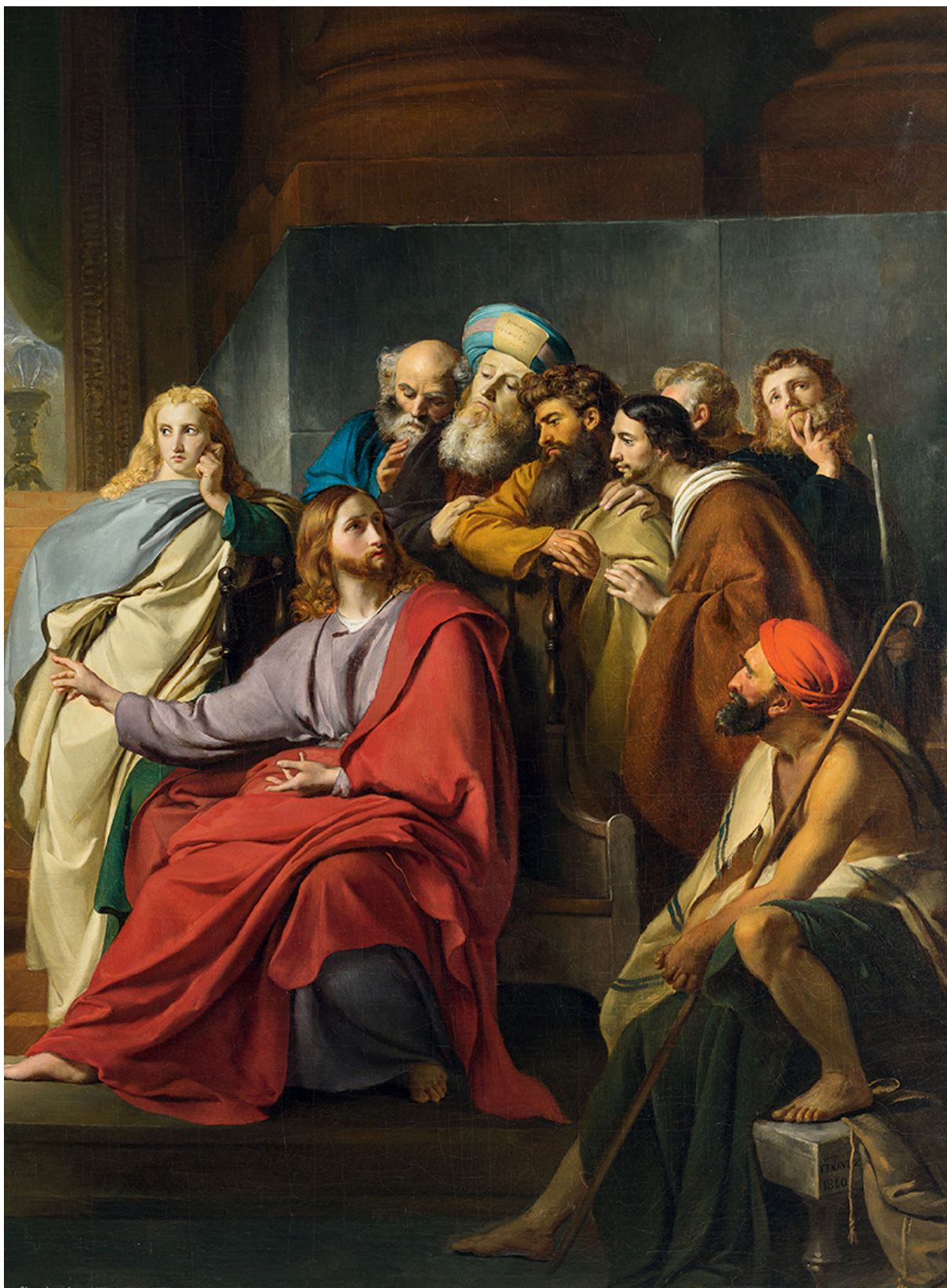
FRANÇOIS-JOSEPH NAVEZ (CHARLEROI, 1787 — BRUXELLES, 1869) L'Obole de la veuve

1840 Huile sur toile 167 × 233 cm Paris, collection Antoine Béal, don sous réserve d'usufruit au musée des Beaux-Arts d'Orléans Inv. 2025.21.1