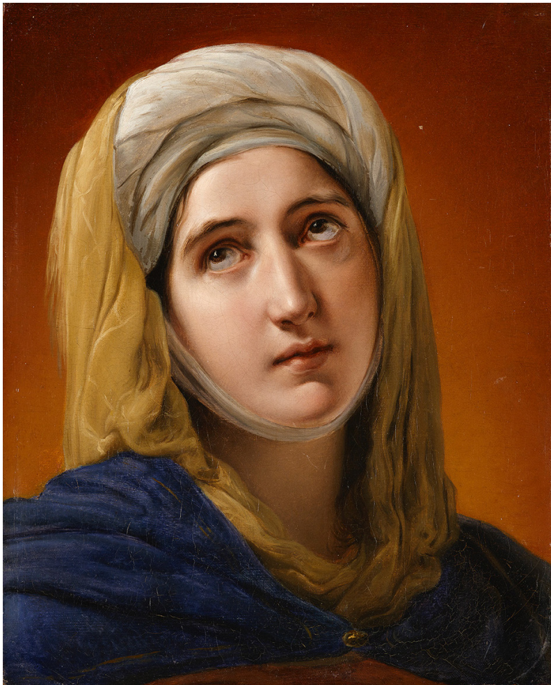
FRANCESCO HAYEZ (VENISE, 1791 — MILAN, 1882) Odalisque

Vers 1840-1845 Huile sur toile 42,5 x 34,7 cm Paris, collection Antoine Béal