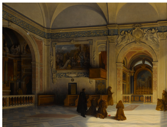
LANCELOT-THÉODORE TURPIN DE CRISSÉ (PARIS, 1782 – id. , 1869) Personnages se recueillant sur la tombe de Charles X à Goritzza

Le goût pour la peinture a pris un tour intellectuel avec le temps, remplaçant la séduction immédiate d'une esquisse par le plaisir d'un sujet complexe et abouti. Les solutions iconographiques trouvées par le peintre, les détails qu'il aura glissés pour construire son sujet, son imagination, la culture savante qu'il exige du spectateur pour plonger dans la toile sont des agréments indispensables. De ces peintures savantes, Antoine Béal a tiré une sympathie pour les artistes du XIX e siècle qui ont œuvré dans le champ de la peinture d'histoire, dans une veine romantique ou académique. Certains sont devenus des évidences, tel Claudius Jacquand, avec qui la collection a véritablement commencé, et face auquel Antoine Béal ne sait résister, même à des tableaux plus secondaires. D'autres sont le fruit d'une longue quête du « bon tableau », comme Évariste Luminais, dont le collectionneur voulait impérativement une oeuvre. D'autres, encore, se sont imposés au détour d'une vente, tel Robert-Fleury avec les incontournables panneaux peints pour l'hôtel particulier de James de Rothschild, mêlant plaisir du sujet et de la provenance. La recherche, parfois issue du travail de spécialistes, implique souvent pour le collectionneur un passage par la documentation du Louvre ou la bibliothèque de l'Institut National d'Histoire de l'Art, pour mieux cerner un tableau. La joie est décuplée lorsque le sujet se précise, la date s'affine ou que la provenance est retrouvée.