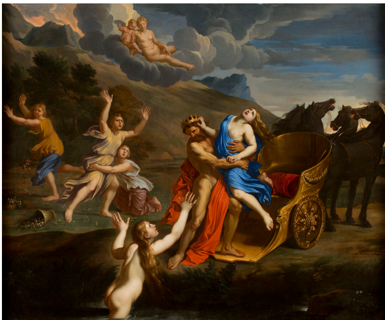
NICOLAS MIGNARD, DIT MIGNARD D'AVIGNON (TROYES, 1606 — PARIS, 1668) L'Enlèvement de Proserpine

Vers 1650 Huile sur toile 83,5 × 103 cm Paris, collection Antoine Béal