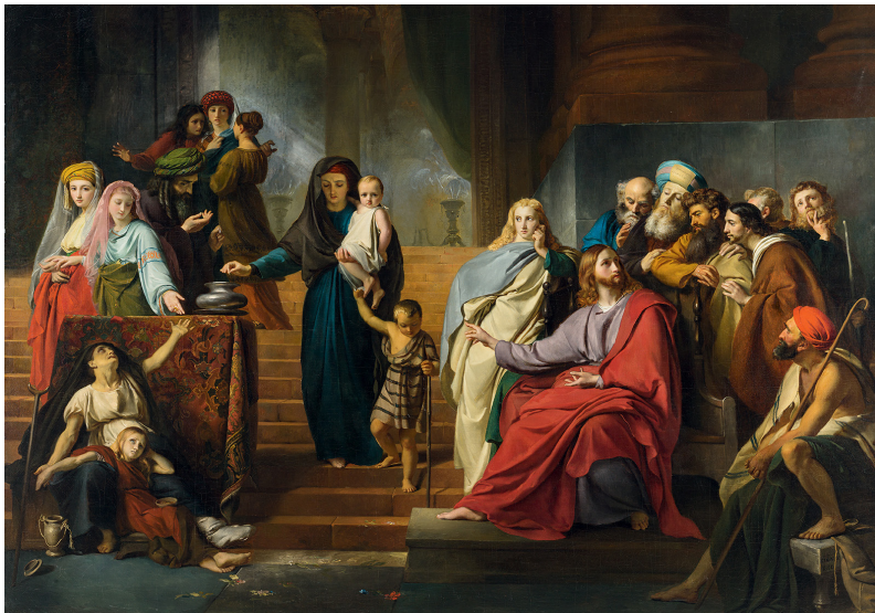
FRANÇOIS-JOSEPH NAVEZ (CHARLEROI, 1787 — BRUXELLES, 1869) L'Obole de la veuve

Vers 1840-1845 Huile sur toile 42,5 x 34,7 cm Paris, collection Antoine Béal