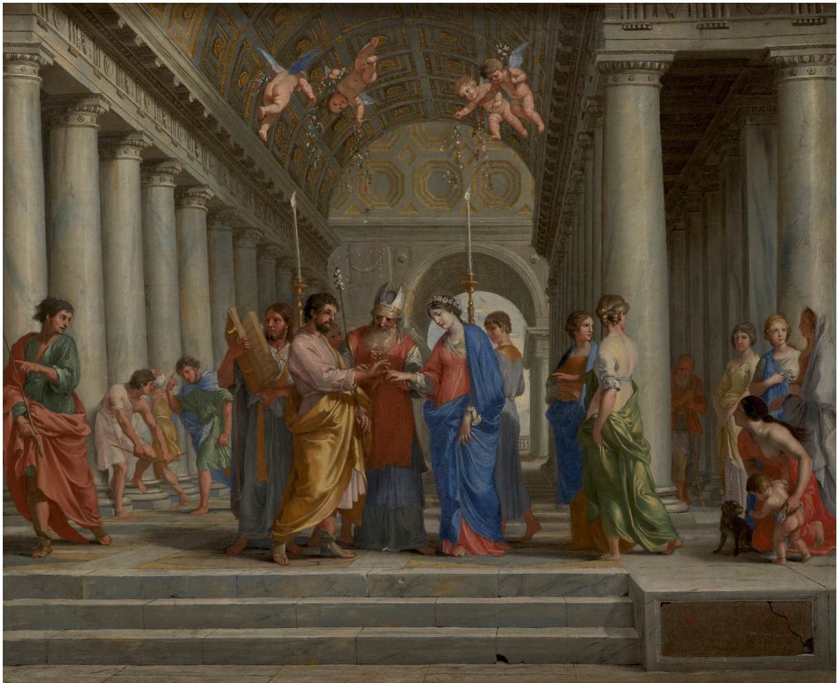
JACQUES STELLA (LYON, 1596 — PARIS, 1657) Le Mariage de la Vierge

Vers 1650 Huile sur toile 83,5 × 103 cm Paris, collection Antoine Béal