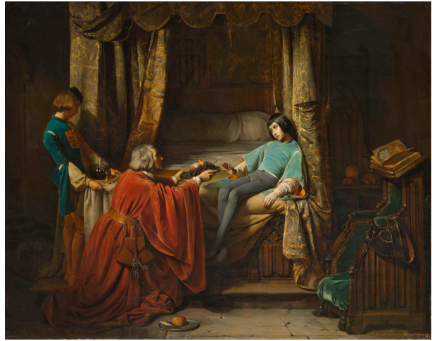
CLAUDIUS JACQUAND (LYON, 1803 – PARIS, 1878) Le Jeune Gaston, dit l'Ange de Foix