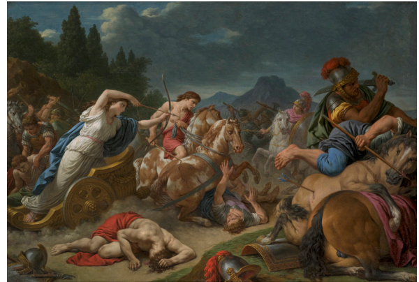
LOUIS JEAN FRANÇOIS LAGRENÉE (PARIS, 1725 – ID., 1805) Bellone appelle Mars au combat en lui remettant les rênes de ses chevaux