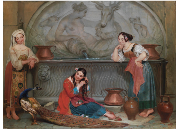
PHILIPPE JACQUES VAN BREE (ANVERS, 1786 – SAINTE-JOSSE-TEN-NOODE, 1871) Italiennes à la fontaine

1838 Huile sur carton 100,7 × 129 cm Paris, collection Antoine Béal