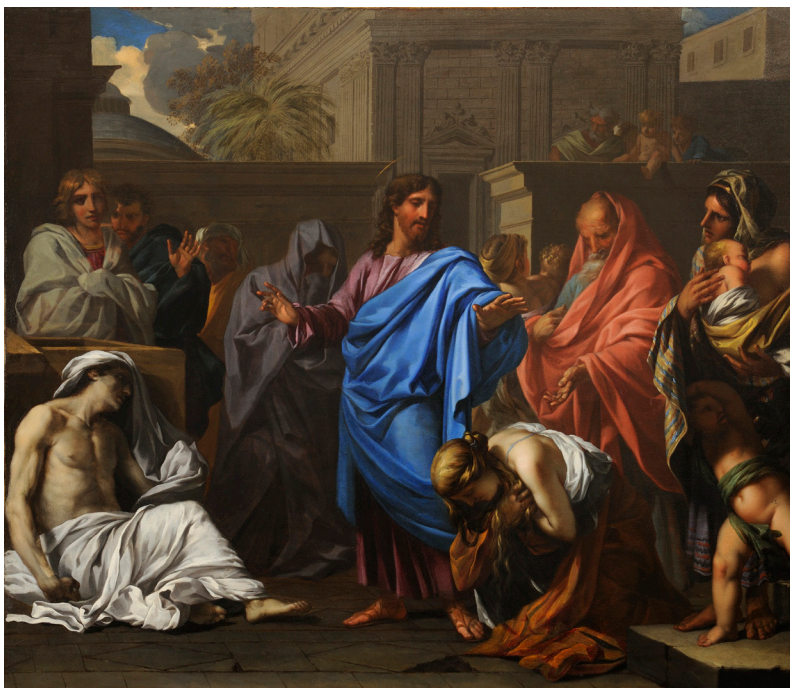
JACQUES STELLA (LYON, 1596 – PARIS, 1657) La Résurrection de Lazare