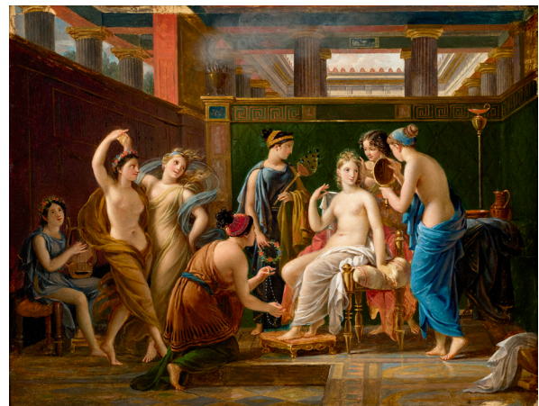
JOSEPH PAELINCK (OOSTAKKER, GAND, 1781 – IXELLES, 1839) La Toilette de Psyché dans le palais de l'Amour

1838 Huile sur carton 100,7 × 129 cm Paris, collection Antoine Béal