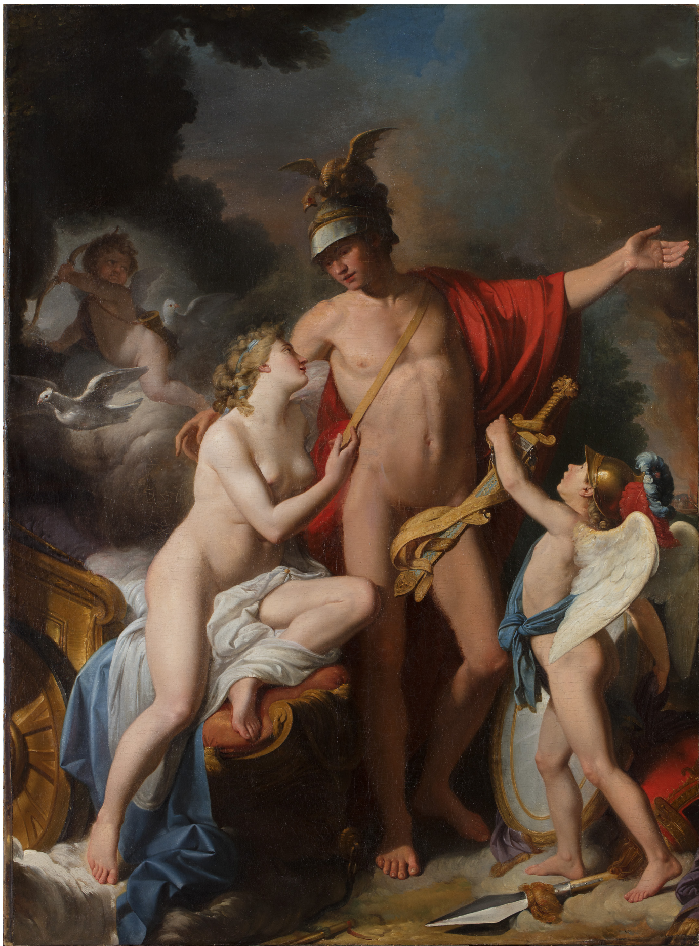
Mars sortant des bras de Vénus pour aller à Troie, 1782