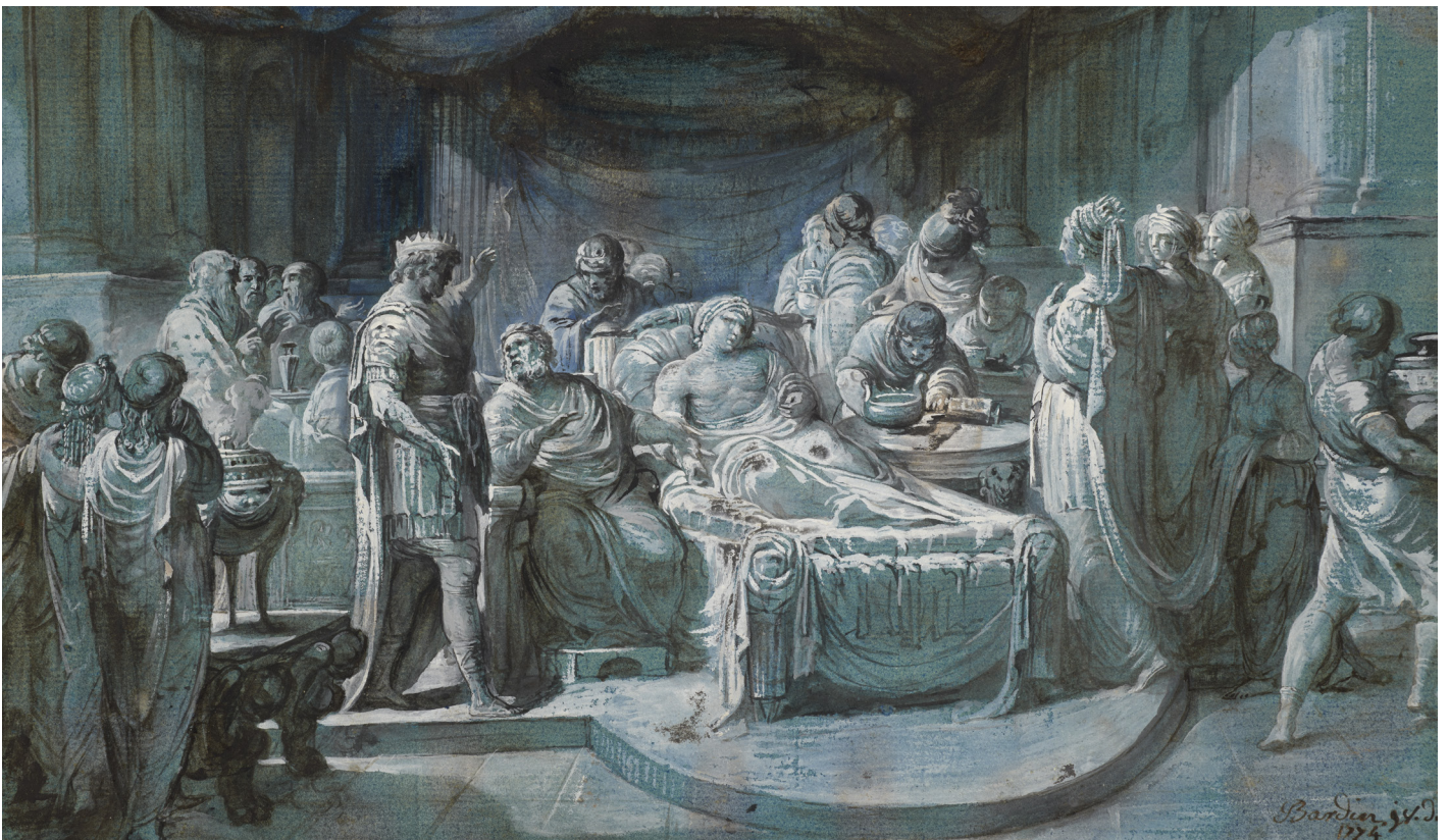
La Maladie d'Antiochus découverte par le médecin Érasistrate, 1774