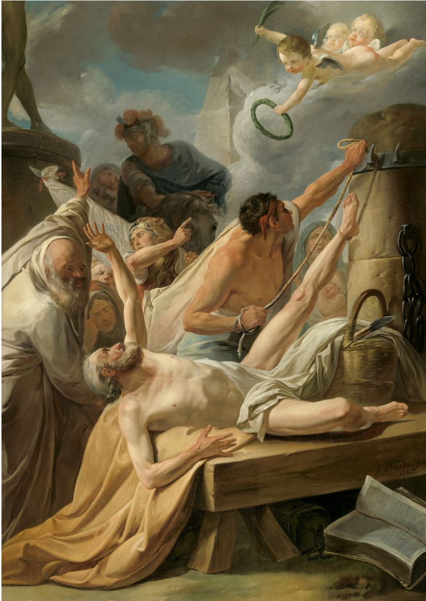
Le martyre de saint Barthélemy