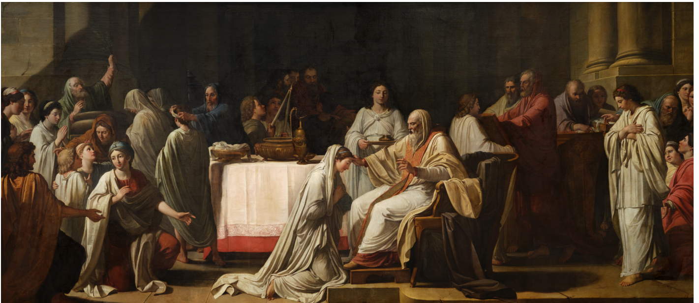
La Confirmation , 1790 © Saragosse (Espagne), chartreuse d'Aula Dei, réfectoire