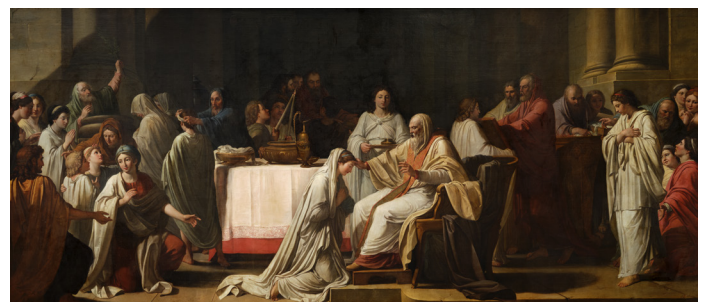
Le Baptême , 1788 Huile sur toile, 216 x 485 cm © Saragosse (Espagne), chartreuse d'Aula Dei, réfectoire