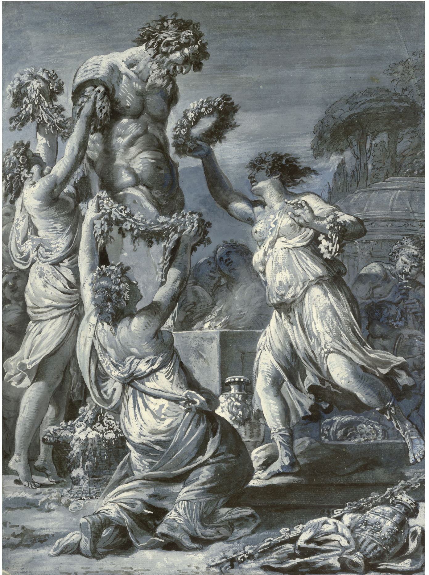
Bacchantes décorant la statue du dieu Pan Vienne, Albertina