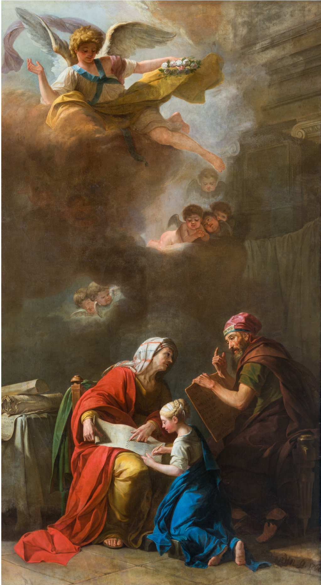
L'Éducation de la Vierge , 1768