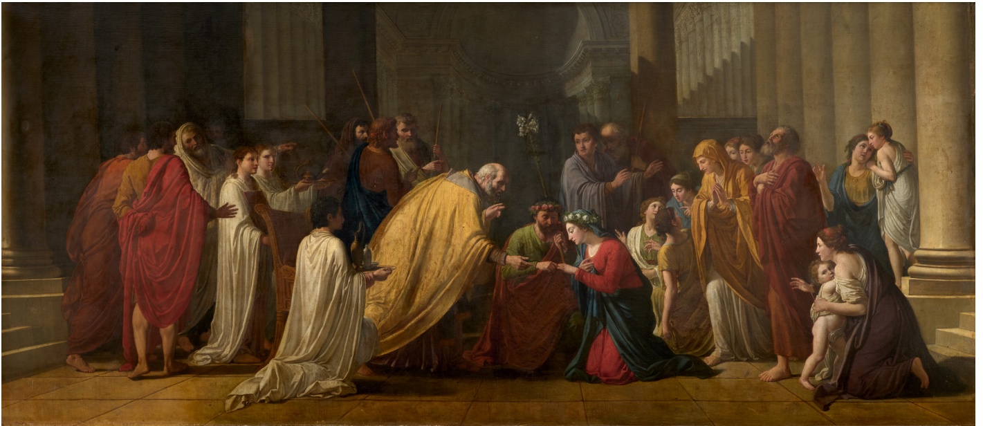
Le Mariage , 1790-1791 © Saragosse (Espagne), chartreuse d'Aula Dei, réfectoire