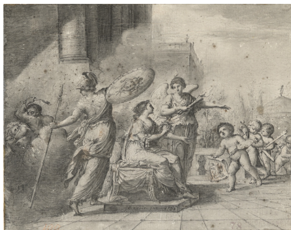
Le Génie du Goût présente les Beaux-Arts à la Gloire, 1786