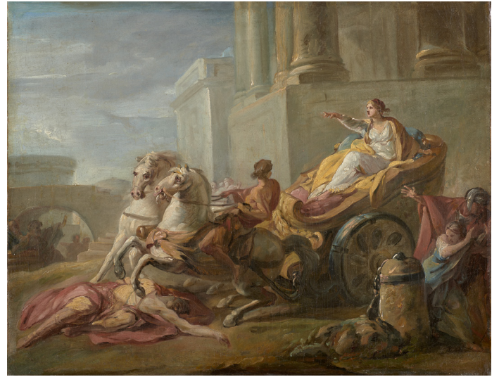
Tullie faisant passer son char sur le corps de son père , 1765 Huile sur toile, 114 x 145,5 cm Mayence, Landesmuseum Mainz