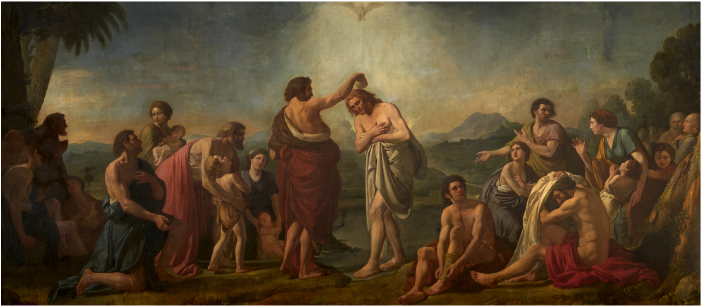
Le Baptême , 1788 © Saragosse (Espagne), chartreuse d'Aula Dei, réfectoire