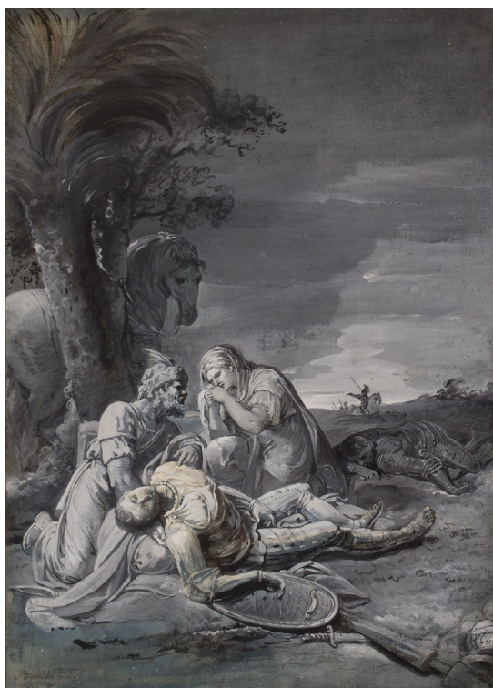
Herminie pleurant Tancrede blessé , années 1780

Reconnu par les amateurs, Jean Bardin franchit une nouvelle étape, en 1779, lorsqu'il est agréé par l'Académie royale de peinture et de sculpture. Dans l'attente de produire un morceau de réception, qui confirmera son intégration, il peut exposer au Salon organisé tous les deux ans au palais du Louvre. Ce nouveau statut renforce sa renommée et le désigne pour des commandes d'envergure de la direction des Bâtiments du roi ou de la Cour. Son ambition de peintre d'histoire, genre le plus élevé de la hiérarchie établie par l'Académie, est couronnée de succès. Entre 1780 et 1781, il peint une Adoration des Mages pour la chapelle de la Trinité du château de Fontainebleau ( in situ ) avant de recevoir la commande par Madame Louise de France d'une Immaculée Conception pour la chapelle du Carmel de Saint-Denis.