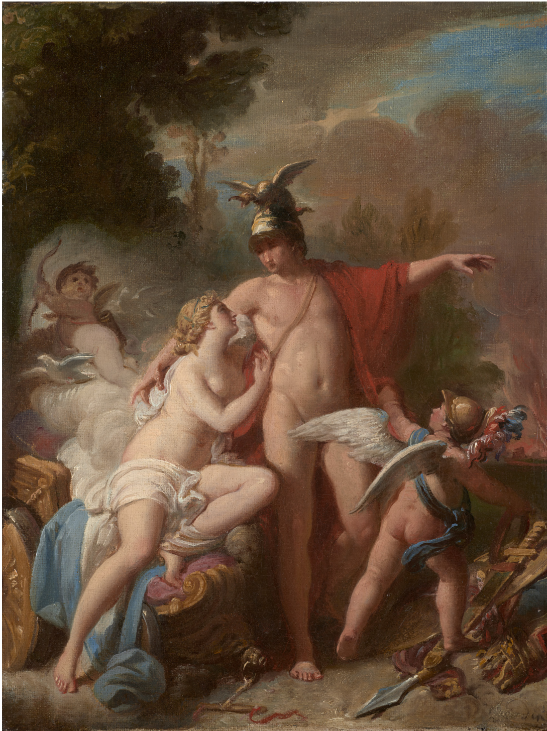
Mars sortant des bras de Vénus pour aller à Troie (esquisse), 1782