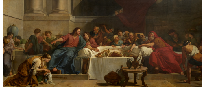
Le Mariage , 1790-1791 Huile sur toile, 216 x 485 cm © Saragosse (Espagne), chartreuse d'Aula Dei, réfectoire