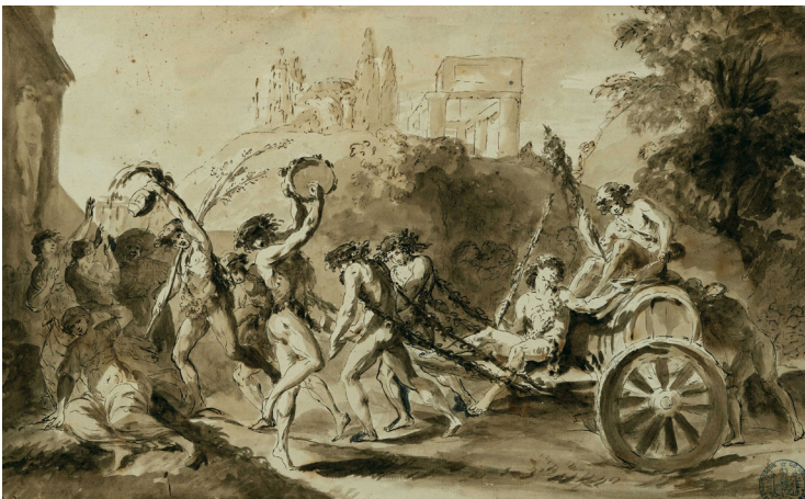
Bacchanale ou Le Retour des vendangeurs, 1768-1772

Son directeur, Charles Natoire, évoque les progrès du lauréat et sa bonne conduite durant les quatre années passées dans la Ville éternelle. Peu nous est parvenu sur ces années romaines, mais les citations fréquentes du plafond de la chapelle Sixtine de Michel-Ange, de la galerie Farnèse des Carrache ou encore d'antiques tel l' Apollon du Belvédère , qui ponctuent les tableaux réalisés à son retour, trahissent l'étude des modèles à laquelle il se livre, comme tous les pensionnaires.