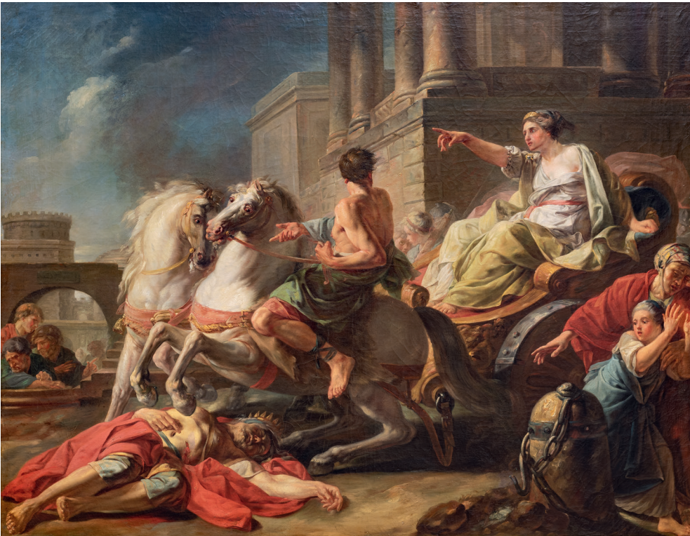
Tullie faisant passer son char sur le corps de son père, 1765 Mayence, Landesmuseum Mainz

Initialement destiné au commerce, qui le conduit de Montbard à Paris à l'âge de seize ans, Jean Bardin s'oriente huit ans plus tard vers la peinture, en entrant d'abord en 1755 dans l'atelier de Louis Lagrenée, de retour de Rome, puis, en 1760, dans celui de Jean-Baptiste Marie Pierre. Cette formation auprès des meilleurs peintres d'histoire et sa détermination à se faire un nom dans la peinture contemporaine lui valent de recevoir le deuxième grand prix de peinture de l'Académie en 1764, puis, en 1765, le premier prix.