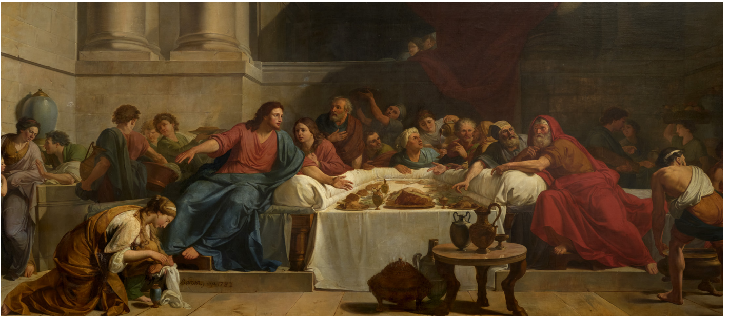
La Pénitence , 1782 © Saragosse (Espagne), chartreuse d'Aula Dei, réfectoire