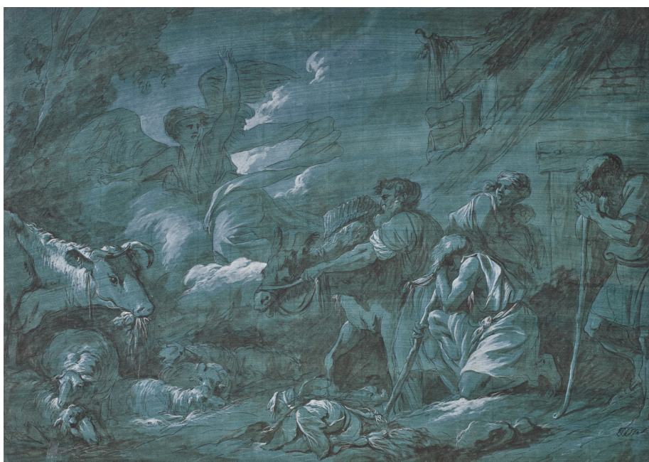
Jean-Jacques Lagrenée L'Annonce aux bergers

L'esthétique coloriste qui s'est développée en France depuis la fin du XVII e siècle, exaltant la touche franche et l'art de mélanger les teintes plutôt que la perfection des contours, s'est traduite dans la pratique du dessin par l'introduction de la couleur. Aux trois crayons chers à Watteau (pierre noire, sanguine et craie blanche) a succédé la sanguine seule chez les contemporains de François Boucher. Le mimétisme du dessin avec la peinture s'accroît au tournant des années 1770 avec le développement du lavis et de la gouache, dont les effets sont proches de l'esquisse peinte. Le papier teinté ou préalablement lavé, en bleu le plus souvent, est privilégié pour faire ressortir le « feu » de la gouache blanche, qui « réchauffe » la composition. C'est à leur virtuosité dans cette manière de peindre en dessinant que Bardin et certains de ses contemporains, tels Jean-Jacques Lagrenée et Jacques Gamelin, doivent leur succès auprès des collectionneurs.