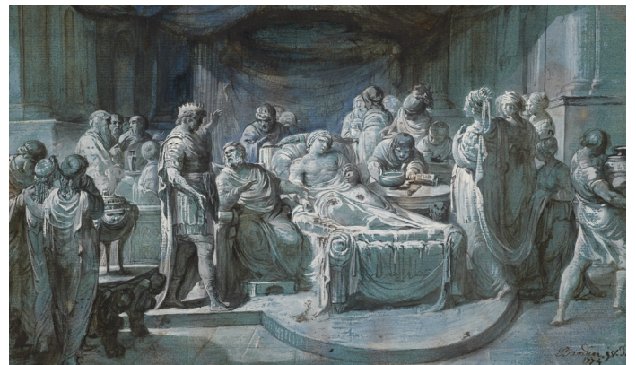
Alexandre malade donnant à Philippe, son médecin, la lettre qui l'accuse , 1999.9.2, 1774 Plume et encre brune, lavis brun et rehauts de gouache blanche, sur papier bleu, 18,3 x 30,5 cm